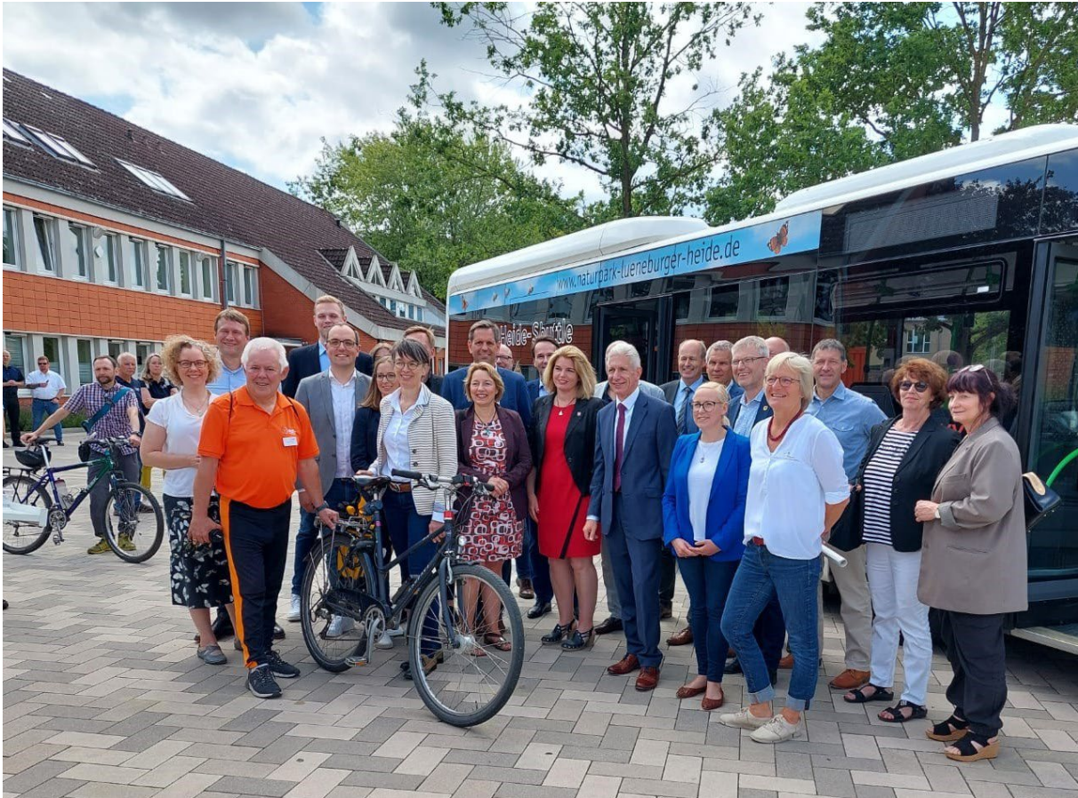
Minister Lies vor dem Heide-Shuttle